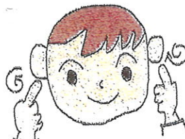
③かえぐりかえぐり(人差し指を耳 の横で穴をほるように回す)