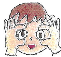
④とつとのめ(両手の親指と人差し 指で目を見開かせるように開ける)