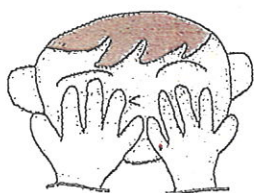
①ちょつ ちょつ (両手で目を隠す)