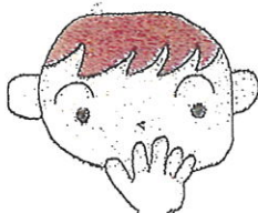
②あわわ(口に手を当てて 「あわわ」という)